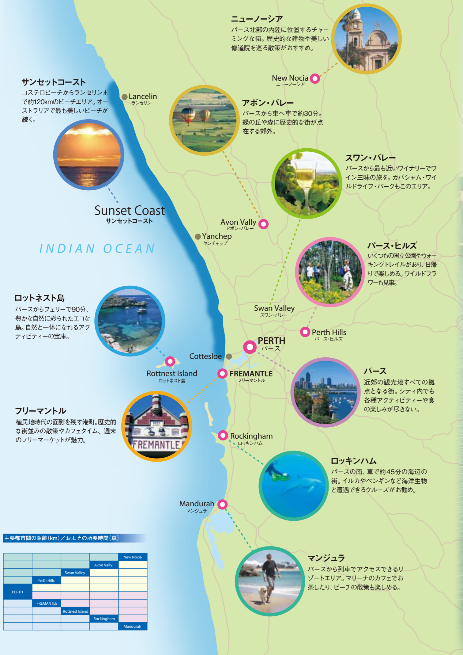
主要都市間の距離 (km) / およその所要時間 (車)